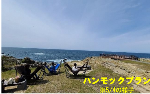
ハンモックプラン ※5/4の様子

5月4日に初参加がありました！ 晴れ間が覗くなかで、ハンモックに揺られながら 楽しんでおられました。 皆様もゆったりと大自然を満喫してみませんか？