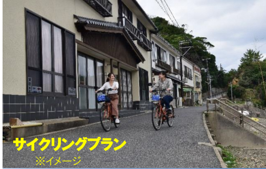
サイクリングプラン ※イメージ

日御碕の初夏がやって来ました！”ピクニック”を楽しんでみませんか？ プランも2つ・オリジナルランチボックスで日御碕の景色を眺めランチ